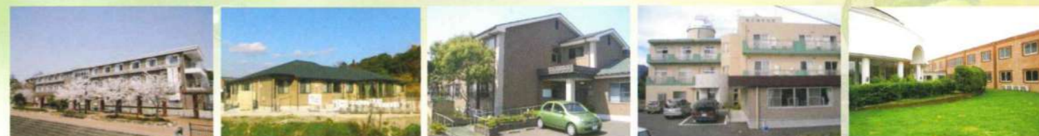
有料老人ホーム パールヴィラ宇美ふれあい館 グループホーム 紫苑のさと グループホーム マーブルくらのうえ 宇美中央デイサービスセンター ふれあい倶楽部 有料老人ホーム パールヴィラ太宰府

TEL 092-918-2007 FAX 092-918-2037 HP http://www.amenitylife-f.co.jp