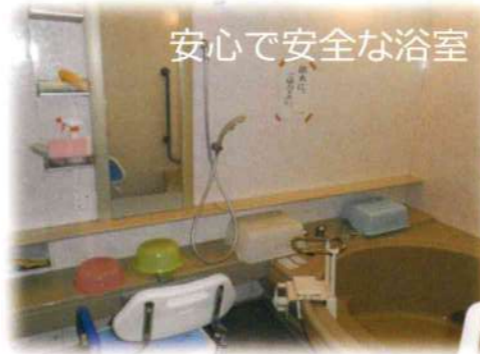
安心で安全な浴室

毎日の献立は「旬の素材」をふんだんに取り入れています。栄養バランスはもちろん「色彩や季節感」を意識した盛り付けです。