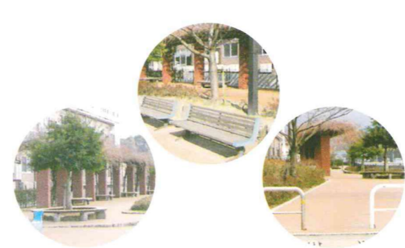
ふれあい館周辺には桜並木や藤棚のある遊歩道など散歩が楽しくなるような道があり、近くにはスーパーもあるので、買い物にも便利です。