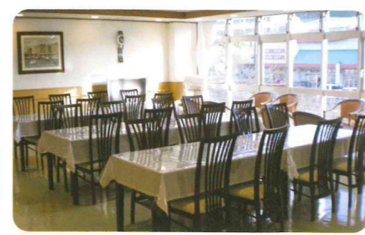
ダイニング 明るい日差しが降り注ぐダイニングでは、おしゃべりや読書などを楽しめます。