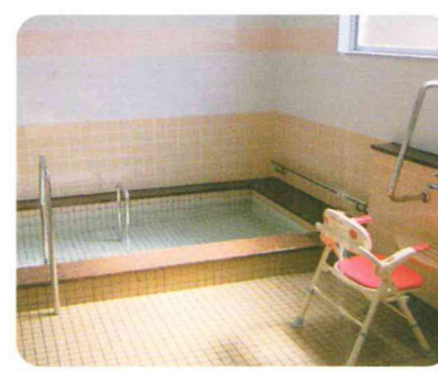
バスルーム 1階に大浴場2ヶ所、2・3階に個人用浴室がございます。