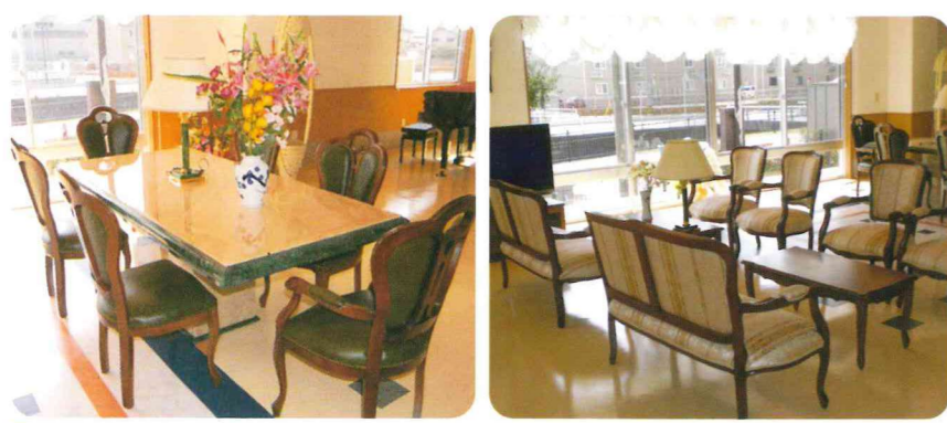
ラウンジ 窓を大きくとり、明るさと開放感にこだわったテイルームは、くつろぎの場所です。