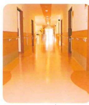
廊下 各フロアごとに廊下の色を変えることで、どの階かわかりやすくなっています。