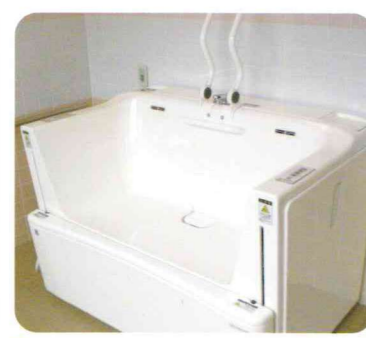
個別浴槽 身体に麻痺がある方も、安心安全に肩までしっかり浸かれ、入浴できます。